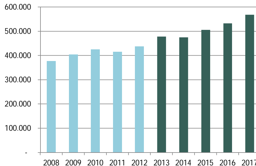
Udvikling i udgifter fra 2008 til 2017 (1.000 kr., 2014 P/L)

Bemærkning: 2008-2012 er realiseret forbrug. 2013-2017 er det oprindelige budget