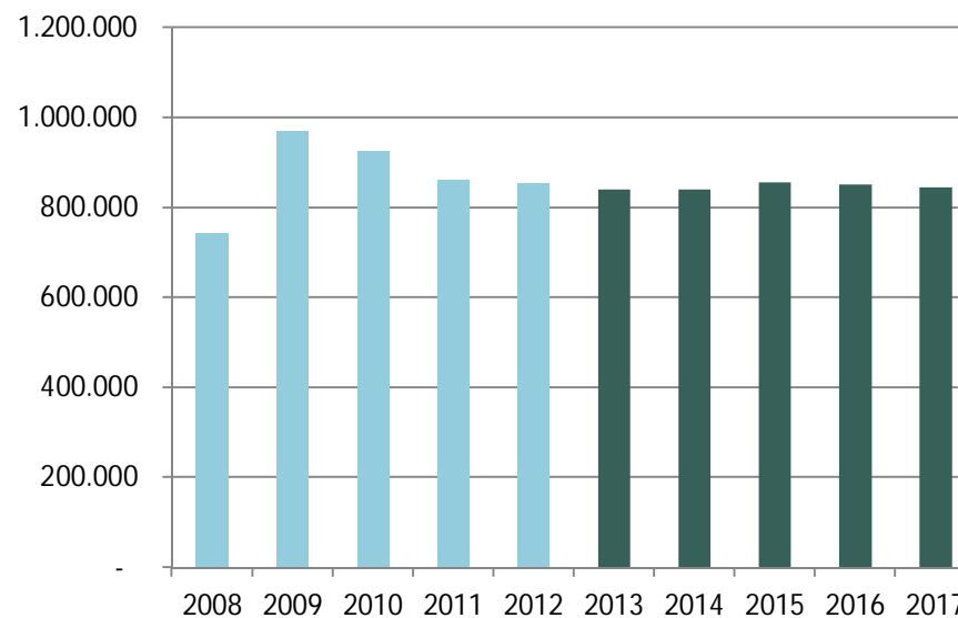
Udvikling i udgifter fra 2008 til 2017 (1.000 kr., 2014 P/L)

Bemærkning: 2008-2012 er realiseret forbrug. 2013-2017 er det oprindelige budget