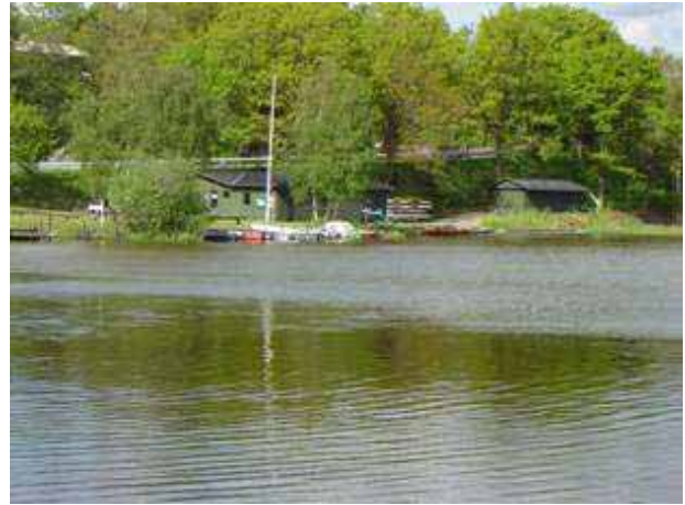
Tange Roklub – og samtidig et af Landsbyens samlingssteder