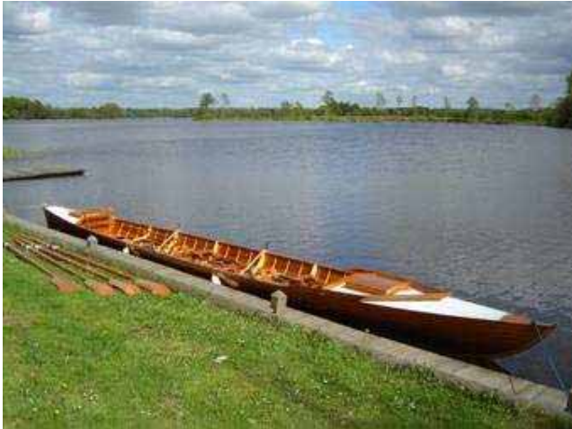
En Robåd – en firer – er klar ved Roklubben