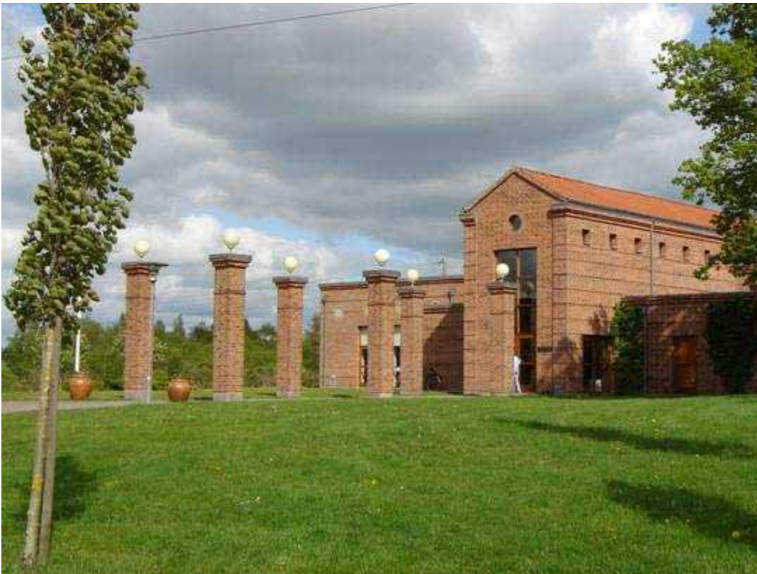
El Museet i Tange