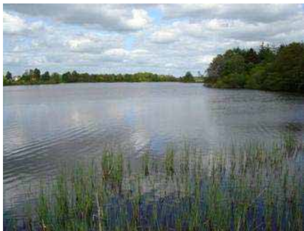
Tange sø – når det er overskyet

Strækningen udgør 33 km af den i alt 80 km lange Træksti fra Silkeborg til Randers. Stien er sikret ved naturfredning på hele strækningen og åben for gående færdsel. Stien ligger mange steder tæt ved vandet, og nogle strækninger kan stien i årets løb være lukket på grund af oversvømmelse. Da stien ofte forløber gennem marker i drift, sker der ofte forandringer på stien og nogle steder skal der forceres kreaturhegn.