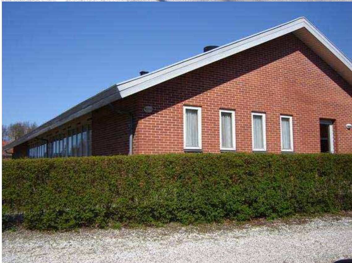
Missionshuset i Tange - for Luthersk Evangelisk Mission