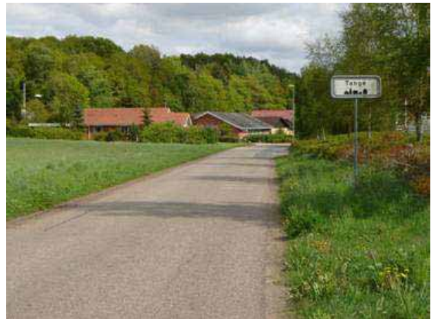
Indkørsel til Tange ad Husbondvej

Landsbyen Tange – beliggende ved Tange sø – og en tidligere stationsby, Men en naturperle i det midtjyske.