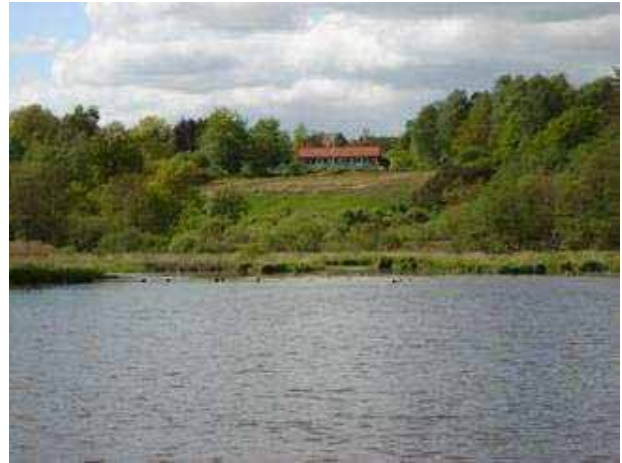
Parti ved Søen