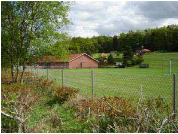
Den Kristne Friskole – set fra Husbondvej