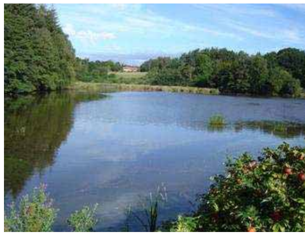
Tange sø i solskin - vi kan her se himlens farve har stor betydning for vandets farve