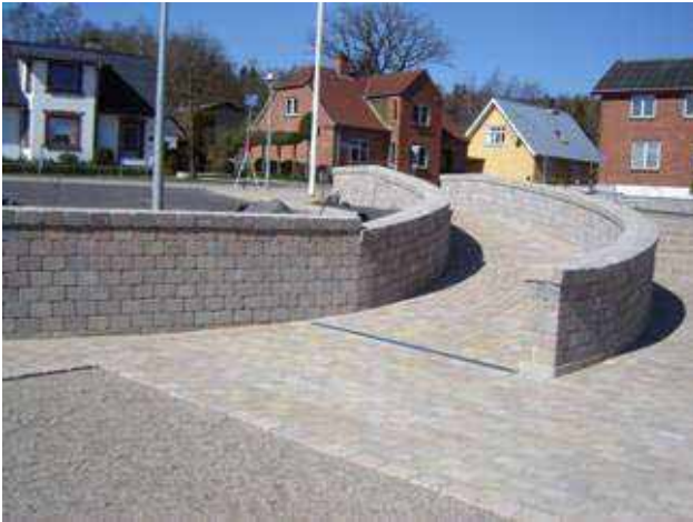
Tange torv med rampe