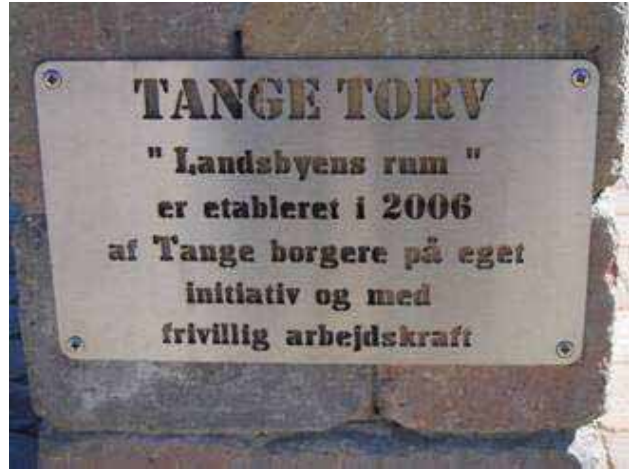
Pladen på torvet

Torvet er som sagt næsten færdigt udført ved frivillig arbejdskraft – støtte fra virksomheder og tilskud fra tidligere Bjerringbro Kommune og §33 tilskud.– og praktiske gøremål fra Tange Borgere.