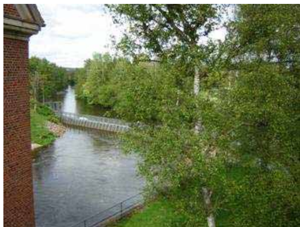
Gudenåen mod Bjerringbro