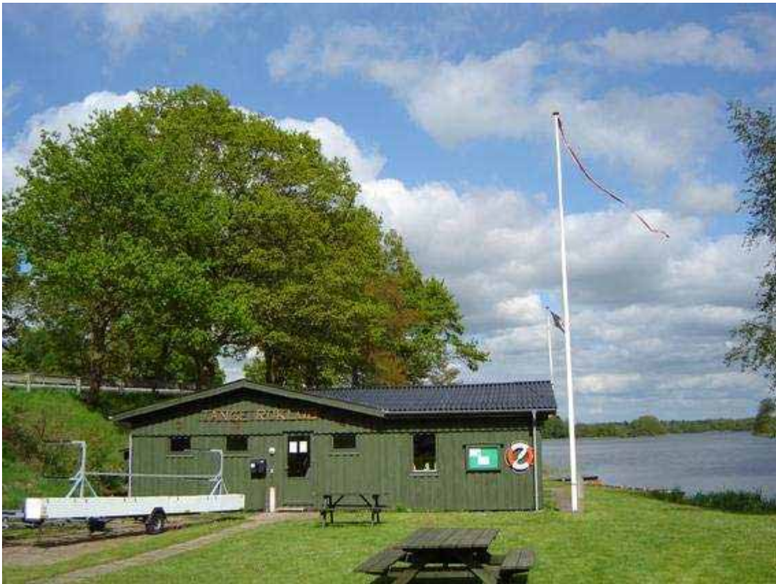
Roklubben I Tange