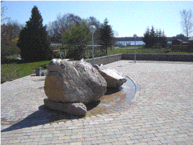
Kunstværket – ” Søkoen ” på Tange Torv