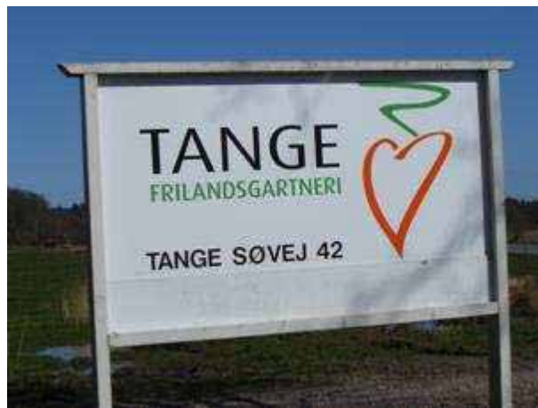
Skiltet med varemærket

Samson Maskinfabrik – producerer Special Pumper.