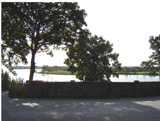
Naturen – og Søen