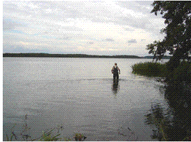
Vurderinger på stedet – hvor Søbadestranden placeres

Af andre initiativer – som er udført eller bliver udført i 2007 er: