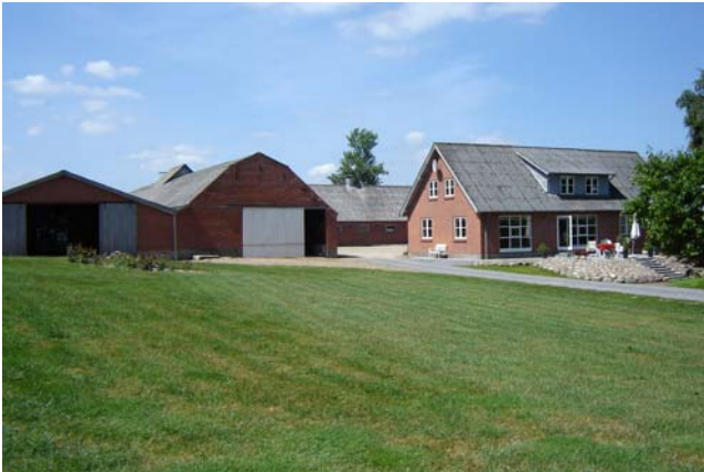
En af gårdene i Nøddelund.