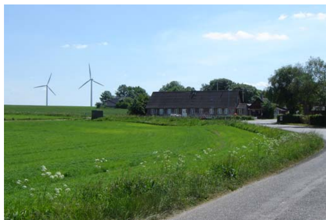
Vindmøller er også en del af billedet i området.

Nøddelund samarbejder på flere områder sammen med Sahl og Gullev. Således at der er visse fælles ting, som man kan hjælpe hinanden med – erfaringsmæssigt.