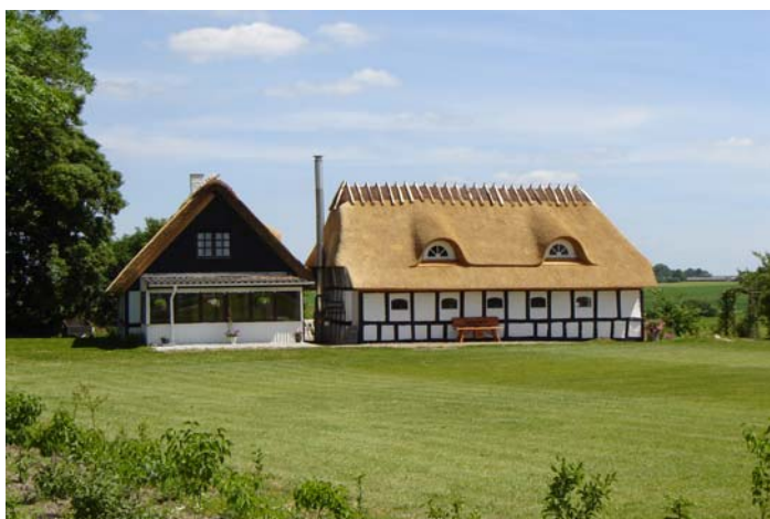
En renoveret ejendom - mellem Nøddelund og Sahl

Kommunekort - Nøddelund er placeret i det sydøstlige hjørne af Bjerringbro Kommune – og den nye Viborg Storkommune.