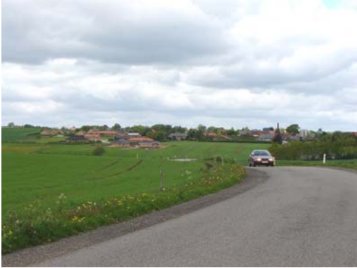
Mammen set fra syd med udsigt over Søndervang