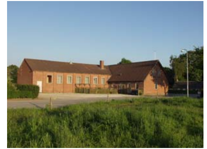
Tidligere skole i Lee