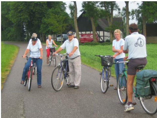
Cykelhold et nyder naturen

Der er her I foråret blevet taget billeder rundt I området, der fortæller om landsbyen og dens liv. Disse billeder er samlet på en cd til inspiration for evt. tilflyttere. Den kan rekvireres hos Holmriis.design 8668 6464