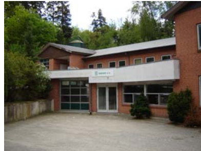
UD vinduer - Vinduesfabrikken