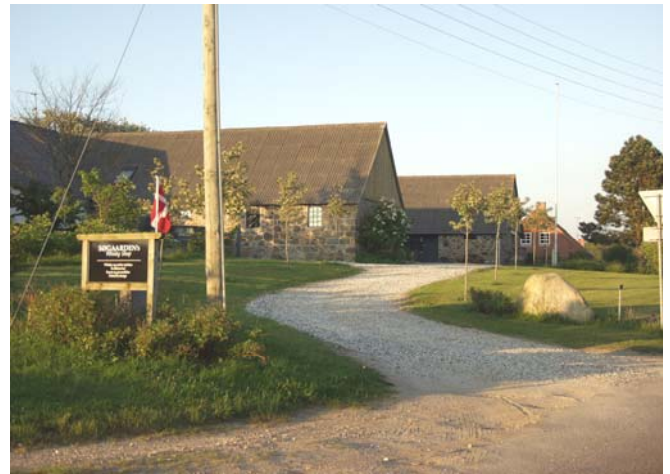
Søgården med whiskyshoppen

tiltrækker turister fra både ind- og udland.