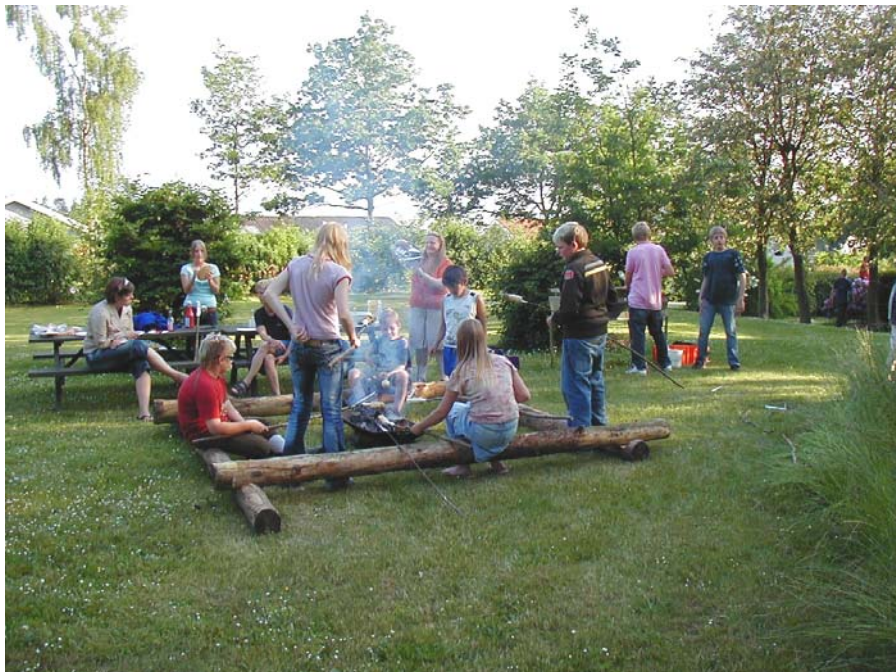
Unge mødes omkring bålet i Lee

I foråret- sommeren 2006 har en gruppe borgere i Lee været samlet for at udarbejde denne borgerplan for området. Der er blevet samlet materiale der beskriver - Status – Muligheder – og Ønsker til Fremtiden for Lee og omegn