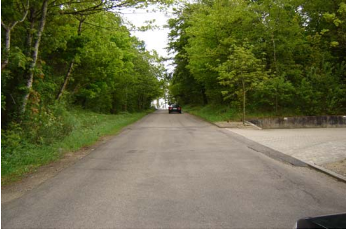
Vejen gennem skoven fra Lee mod Hjorthede

På "Søgaarden" findes idag en specialbutik med whisky o.lign., samt kunst og gaveartikler, som bl.a.