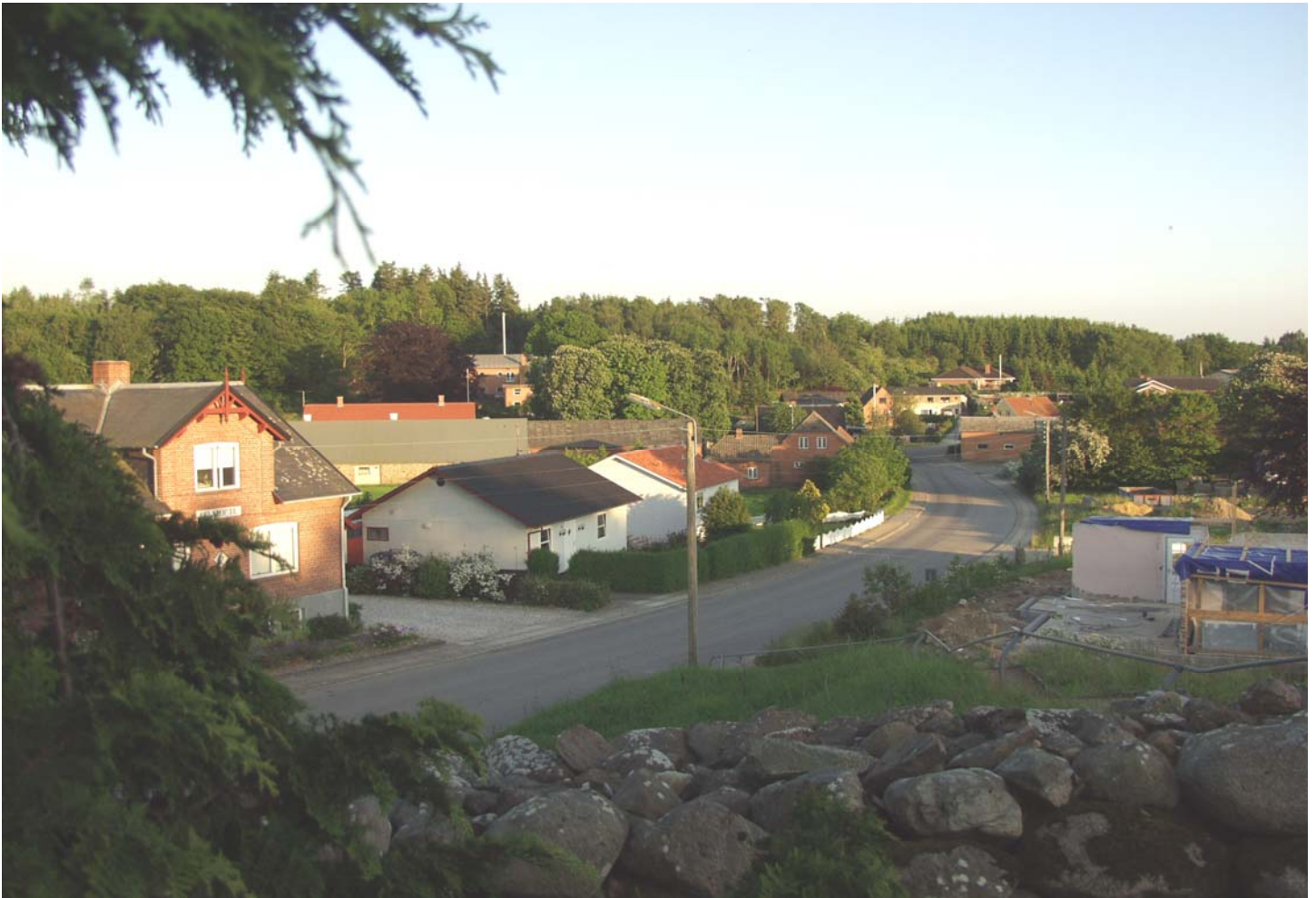
Et view over Landsbyen Lee