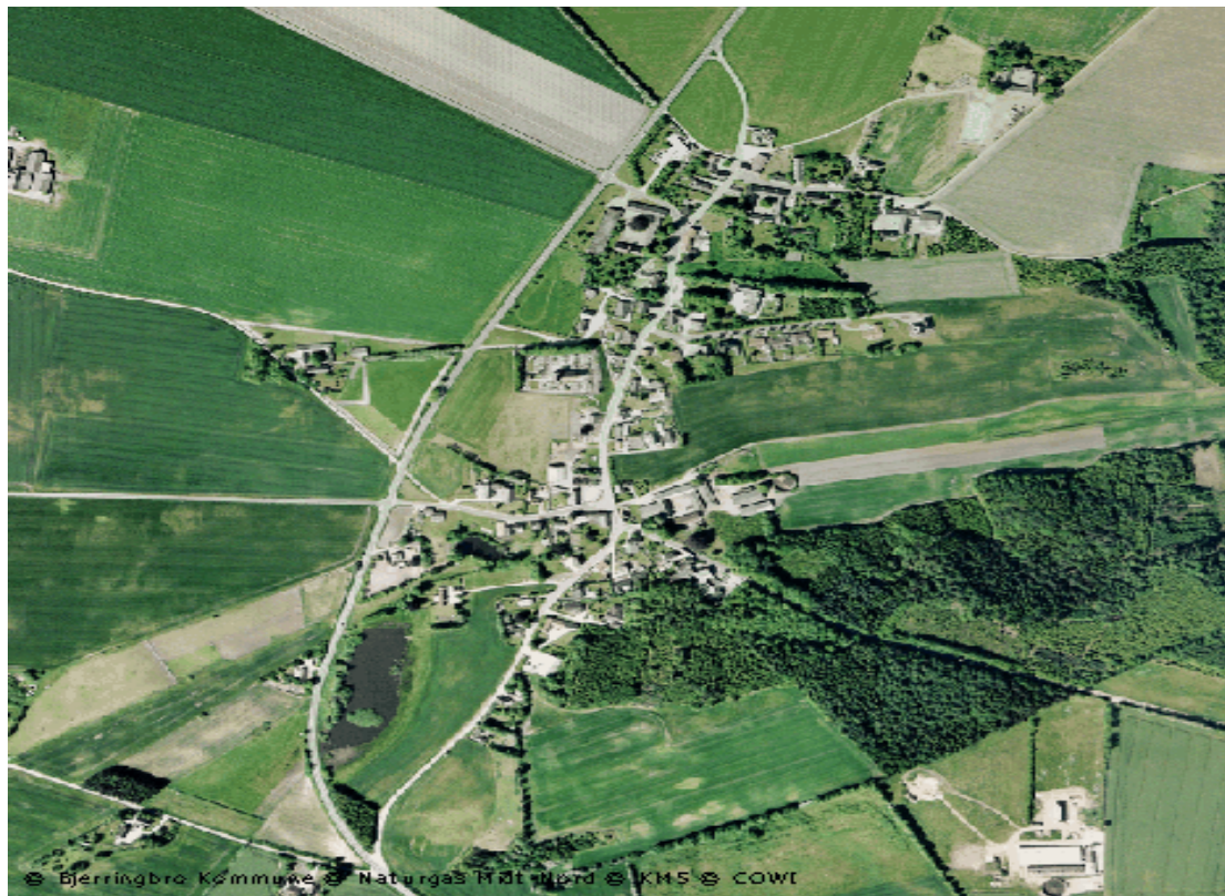
Luftfoto af Landsbyen Lee

Mere detaljeret beskrivelse af Hal og Skjern skole – på de efterfølgende sider.