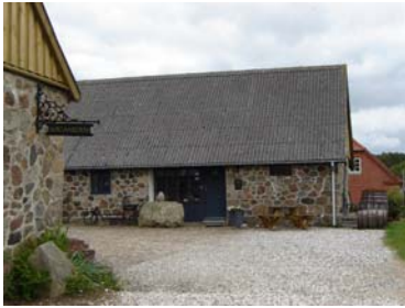
Søgården – en kampestensgård

”Mangehøje ” udgjorde oprindeligt 10 høje , hvoraf kun 3 er bevaret. I alt 50 høje er desværre blevet sløjfet eller ødelagt gennem årene. Ved Himmestrup markskel lå der tidligere en helligkilde, som blev flittigt besøgt af folk fra nær og fjern.