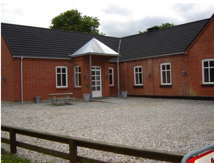
Forsamlingshuset i Bjerring