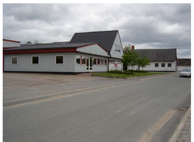
Bjerring: Spærfabrik – Stålbearbejdning

Der er foretaget en gennemgribende renovering af