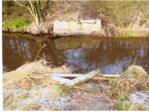
Fundamenter til den nu fjernede gangbro

Ønsket om genetablering af stiforbindelsen har endvidere været rejst af et byrådsmedlem i forbindelse med behandlingen af kommunens budget for 2013.