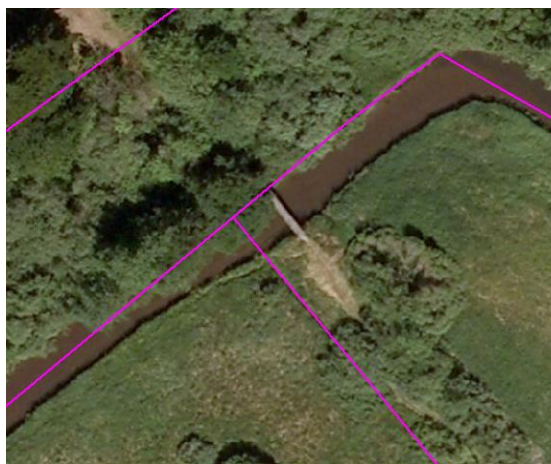
Oversigtskort KMS med stiforbindelsen synlig Luftfoto fra 2010 med gangbroen synlig