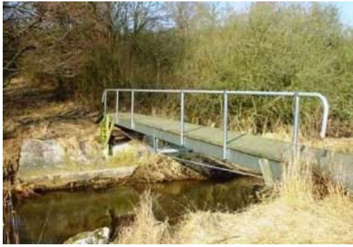
Den tidligere gangbro – foto DN.