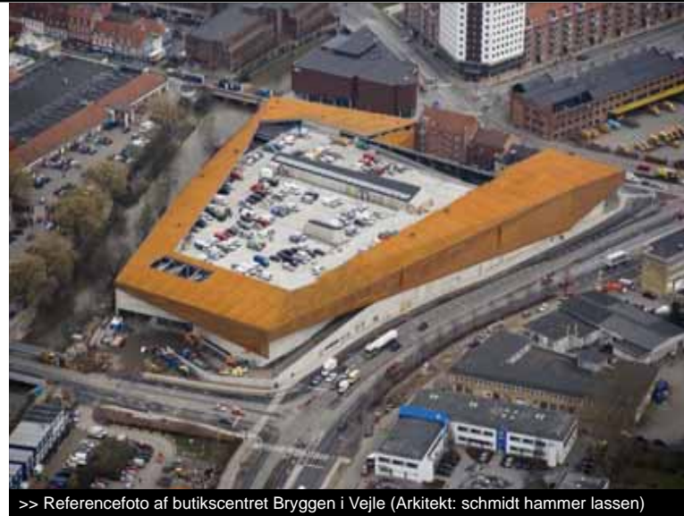
>> Referencefoto af butikscntret Bryggen i Vejle (Arkitekt: schmidt hammer lassen)

Herfra kan der etableres en forbindelse fra handelscenteret til Sønderøparken ved at forstærke akse over Sønderøparken og evt. afslutte med en anløbsbro/ café.