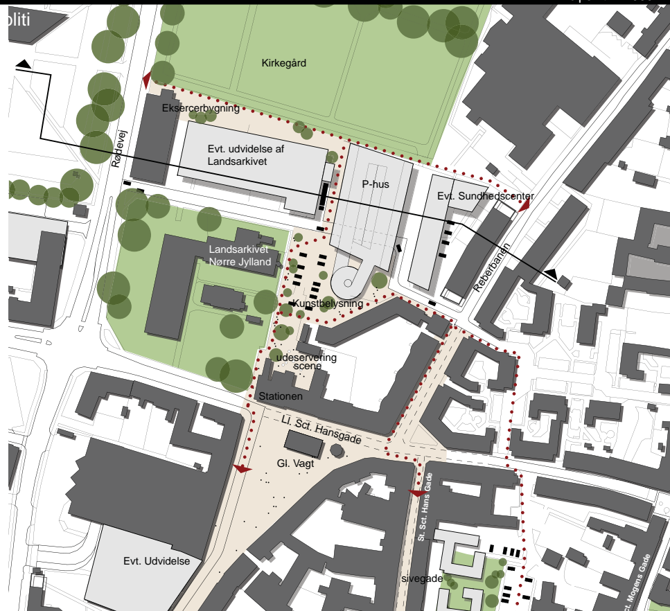
Planudsnit af landsarkivet 1:2.000 >>

For at mindske den gennemkørende trafik fra den vestlige til den østlige del af midtbyen (over Nytorv) foreslås Ll. Sct. Hans Gade ensrettet mod vest fra Reberbanen til "Stationen".