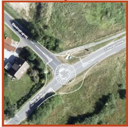
Forslag til krydsombygninger der leder trafik uden om Stoholm bymidte © COWI / 17. januar 2017 / K&C I:\Cowi\net\proj\1A86570\00\DK\iser_K&C